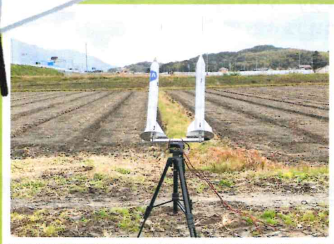
ロケット教室RISEさん