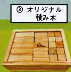
③ オリジナル 積み木