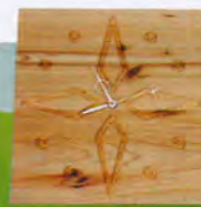
⑤ オリジナル 掛け時計