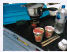
雪の中で食べるカップラーメンは格別でした。