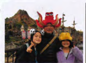
東京ディズニー・シー