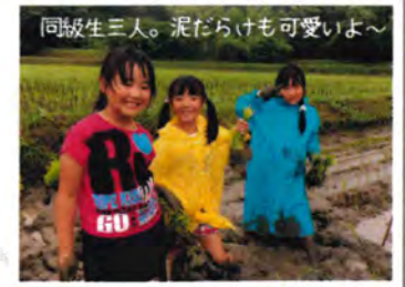
同級生三人。泥だらけも可愛いよ～