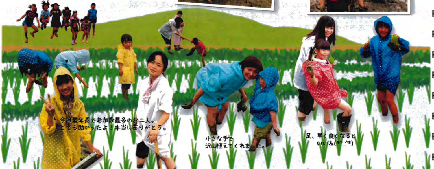
今回最年長で参加数最多のお二人。 とても助かったよ！本当にありがとう。