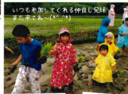
いつも参加してくれる仲良い兄妹 また来てね～(笑)