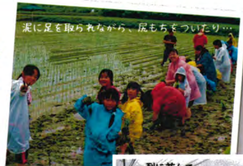
泥に足を取られながら、尻もちをついたり…