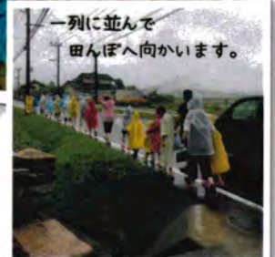
一列に並んで 田んぼへ向かいます。