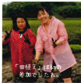
「田植え」は初の参加でしたね。