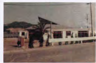
昭和50年頃の写真です。

この4月からは、「かみあり保育園」という新しい保育園としてまた生まれ変わります。