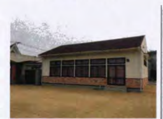
平成14年に建てた多目的ホール