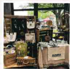
イベント会場販売風景