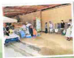
人気のキッチンカーも大人気でした！！