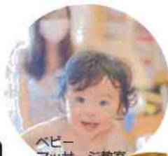
ベビー マッサージ教室