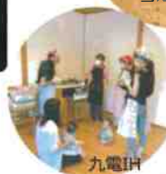
九電研 クッキング教室