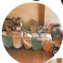
ハンドメイド イベント