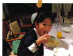
最後にツケがきた長女