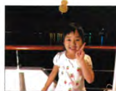
今年の夏も自由奔放な次女